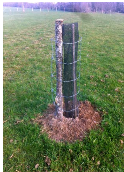
Protection : en ursus.