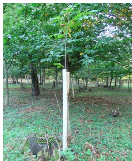
Protection : en tubex.