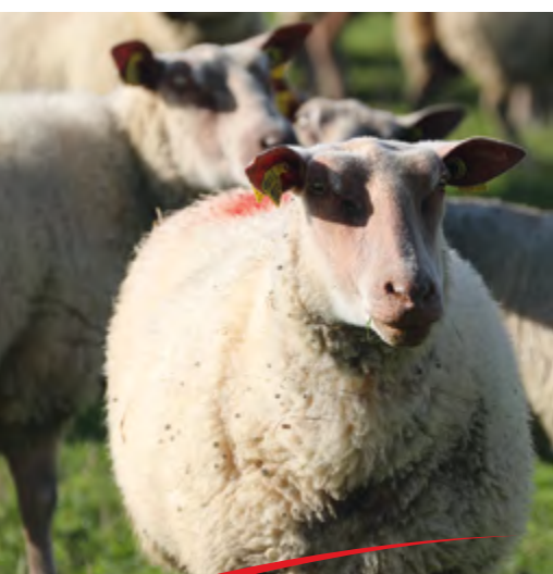
L'aliment a été testé avec des brebis de races Mouton Vendéen et Rouge de l'Ouest.