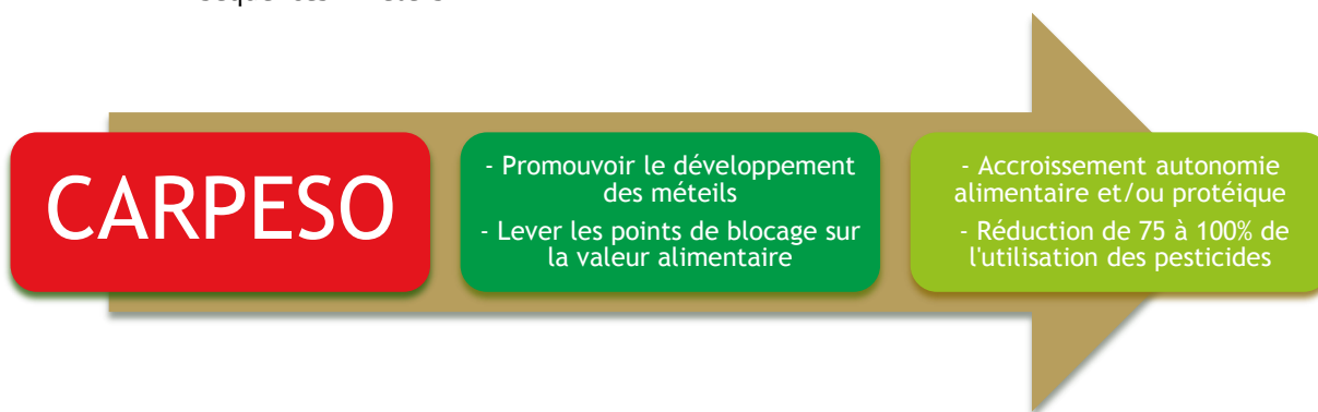
Figure 1 : Représentation schématique des principaux objectifs du projet CARPESO